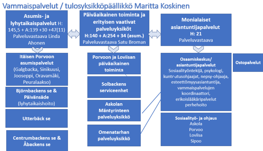
Figur 2. Förslag till struktur för handikappservicen

Fördelningen av ansvarsområdena för handikappservicens serviceansvariga är följande: boendeservice och korttidsvård, dagverksamhet och särskilt krävande serviceenheter samt multiprofessionella experttjänster, dit också de köpta tjänsterna hör. Av figur 2 framgår personalstyrkan (H) och klientantalet (A) vad boendeservicen och dagverksamheten beträffar.